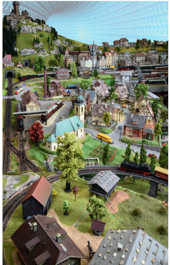
Digitale controle: op het CS3 kan het trajectverloop worden afge- beeld en kunnen de terugmeldingen worden geïntegreerd, zodat betreffende rijwegen door de wissels en seinen worden geschakeld.

Zowel in de GFP3 als bij de ingang voor de Link s88 kan nog worden ingesteld, met welke intervallen de →