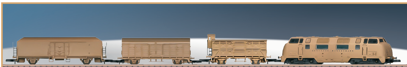
88207: sinds 2019 vast onderdeel van de familie van Mini-Club: de Bronze Feinguss Edition. De fabrieksmodellen – hier de V 200 met goederenwagen – zijn handmatig gegoten, bekoren door hun hoogwaardige bewerking en chique speciale verpakkingen.