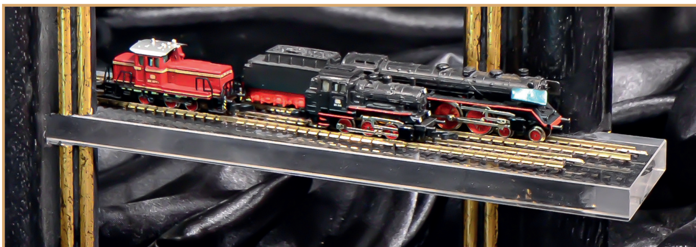
Het assortiment Mini-Club van het eerste uur: serie 89, 003 en 260, samen met een serie 216, wagen 21 en een bijna volledig railprogramma. In 2012 bracht Märklin een jubileumset met drie van de vier eerste locs voor de 40e verjaardag weer uit.