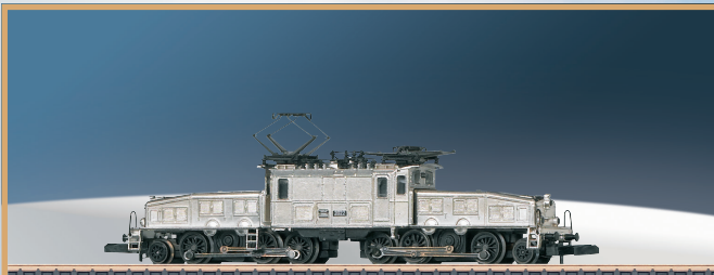
88569: waardig jubileummodel 2022: een exclusieve speciale uitvoering van de SBB "Krokodil" (Krokodil) Ce 6/8 III 14305, bekleed met platina.

Toen Märklin in 1972 de kleinste modelbaan ter wereld voorstelde, kon niemand vermoeden hoeveel liefhebbers ooit door het spoor op schaal 1:220 zouden bekoord worden. Of welke fascinerende modellen met uiterst nauwkeurige details zouden worden uitgevoerd.