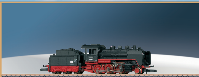
88032: klokankermotor, fijne stangen: stoomlocomotieven (hier de huidige loc van de serie 37) zijn een wondertje van techniek.