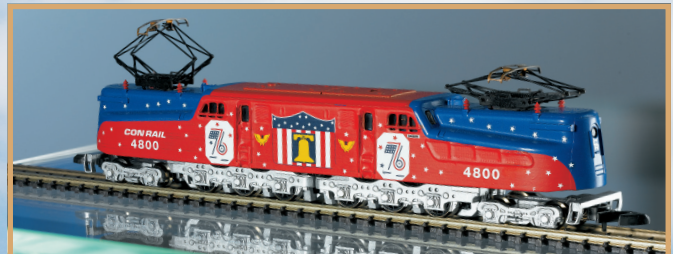
88491: een echte blikvanger: de multifunctionele locomotief GG-1 uit 2005 met de fictieve kleuren "Stars and Stripes".