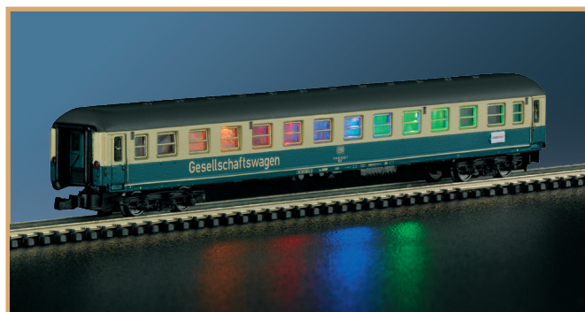
87210: technisch hoogtepunt voor Z in 2020: het entertainment-reizigersrijtuig van de Deutsche Bundesbahn (DB) met ingebouwde "discoverlichting".