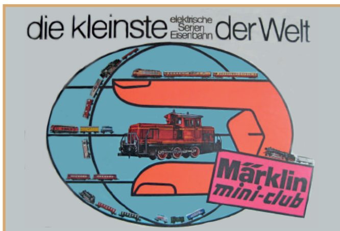
Trots stelt Märklin de kleinste standaard voor elektrische spoorwegen ter wereld voor: reclamecampagne start Spoor Z in 1972.

Dat begon met de serie 144, die in de H0-uitvoering nog niet bestond, en een serie 86, die als eerste net als het voorbeeld rood uitgevoerde stangen had. →