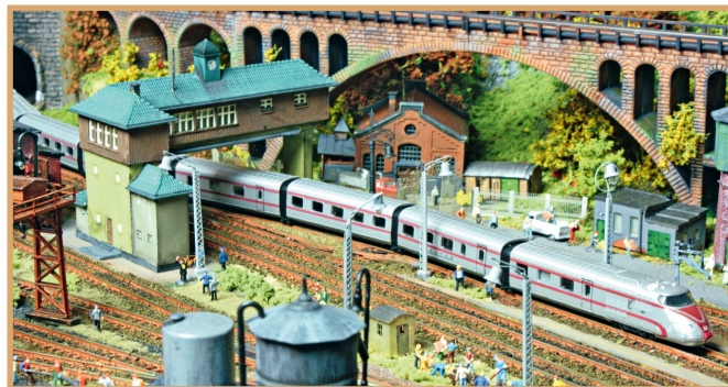
88100: sneltreinmotorwagen VT 10.5 "Senator" uit 2008, behalve de ICE-versies een van de langste aparte modellen voor Z.

In de volgende uitgave (MM 03/22) geven we een overzicht over de later geleverde clubwagens voor Spoor Z en belichten we legendarische treinstellen.