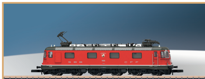
88240: compleet nieuwe constructie in 2022: de Re 6/6 van de SBB met klokankermotor en bewegende spoorstaafruimer.