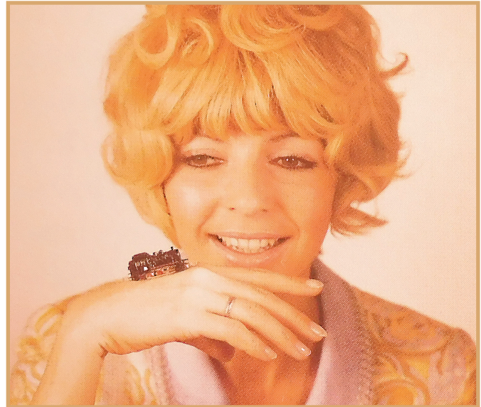
Volwassenen als doelgroep: met opvallende reclame wou men in de jaren 1970 de bekendheid van Spoor Z verhogen.

→ In 1988 werden de fans van Spoor Z enthousiast voor speciale edities: de treinsets "Poppa", "Greaseball" en "Elektra". De motieven stamden uit de musical "Starlight Express", die over de hele wereld zeer succesvol was, en over een wedstrijd tussen drie generaties locomotieven ging. Tot nu wordt hij in Duitsland – in Bochum – opgevoerd. Verder stelde Märklin in de Bochumer Halle een 200 m 2 grote installatie voor, die de bezoekers van de voorstelling de fascinatie voor de modelbaan voor ogen toverde.