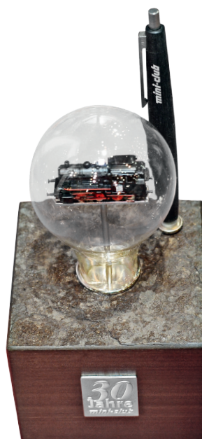
Als verzamelobject nu nog altijd veel gevraagd: de tafelset van de serie 89 in een gloeilamp met kogelpen van 2002.