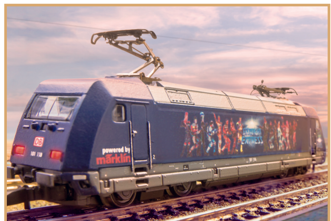
In 1988 met het begin van de musical en ook in 2013 bij het 25-jarige jubileum draait in Spoor Z alles rond "Starlight Express".

Al in 1984 bracht Märklin met de legendarische "California Cephyr" – met een F7-diesellocc vooraan – een eerste model uit de V.S. uit. Hoeveel er naar het nieuwe spoor werd gevraagd, wordt duidelijk doordat de hoofdcatalogus van 1986 moest worden herdrukt. Kort na de levering was de eerste oplage al uitverkocht, alsof het boek de hand-laren bijna uit handen werd gerukt. Net zo verging het het jubileummodel voor het 20-jarige bestaan van Mini-Club in