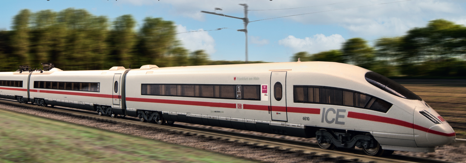
88715: elegant en rank, ook op schaal 1:220: de huidige ICE 3. Als achtdelig treinstel met het middenrijtuig (87716, 88715) heeft het een indrukwekkende lengte van meer dan 920 mm.