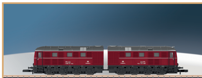
88150: lekkernij voor alle fans van Spoor Z: de dubbele dieselloco V 188 001 van de DB, het exclusieve clubmodel van 2021.